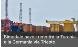
Bimodale nave-treno tra la Turchia e la Germania via Trieste