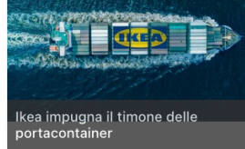
Ikea impugna il timone delle portacontainer