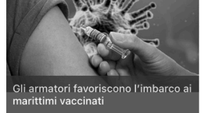
Gli armatori favoriscono l'imbarco ai marittimi vaccinati